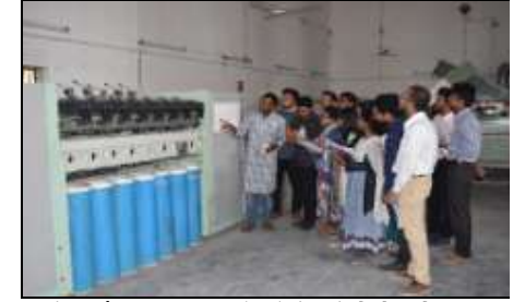
ইয়ার্ন ম্যানু. ল্যাব (টেক্সটাইল ইঞ্জিনিয়ারিং)

'আইপিই' বিভাগের জন্য রয়েছে ফ্লুইড মেকানিক্স এন্ড মেশিনারি ল্যাব, থার্মোডিনামিক্স এন্ড হিট ট্রান্সফার ল্যাব, ম্যাটেরিয়ালস এন্ড মেকানিক্স ল্যাব, ম্যানুফেকচারিং প্রসেস ল্যাব, মেকানিক্যাল ওয়ার্কসপ, ড্রয়িং ল্যাব, নিজস্ব কম্পিউটার ল্যাব, সলিড মেকানিক্স ল্যাব, সিএনসি ল্যাব, ফাউন্ড্রি এন্ড কাস্টিং ল্যাব, এবং প্রোডাক্ট ডিজাইন এন্ড আর্গনোমিক্স ল্যাব।