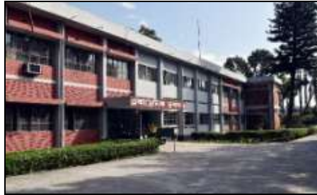
নিটার একাডেমিক ভবন

নিটারে একাডেমিক কার্যক্রম পরিচালনার জন্য দেশের বিভিন্ন খ্যাতনামা বিশ্ববিদ্যালয় থেকে ডিগ্রী প্রাপ্ত মেধাবী এবং উত্তর আমেরিকা, জাপান, জার্মানী, ইতালি, কোরিয়া, তুরস্ক, চীনসহ বিশ্বের বিভিন্ন দেশের স্বনামধন্য বিশ্ববিদ্যালয় থেকে উচ্চতর ডিগ্রী (এমএসসি ও পিএইচডি) সম্পন্ন এবং বিভিন্ন শিল্প প্রতিষ্ঠানে কাজের অভিজ্ঞতা সম্পন্ন প্রায় ৮০ জন স্থায়ী শিক্ষক নিয়োজিত রয়েছেন। এছাড়াও নিটার হতে ইউরোপ এবং আমেরিকার বিভিন্ন খ্যাতনামা বিশ্ববিদ্যালয়ে ১০ জন শিক্ষক উচ্চশিক্ষার জন্য বর্তমানে শিক্ষা ছুটিতে রয়েছেন। ছাত্র-ছাত্রীদের অধ্যয়নের জন্য নিটারে রয়েছে প্রায় ২০,০০০ বই সমৃদ্ধ একটি আধুনিক ও ডিজিটালাইজড লাইব্রেরি। গবেষণা কার্যক্রম পরিচালনার জন্য এখানে রয়েছে ১ টি স্বতন্ত্র 'Center for Research and