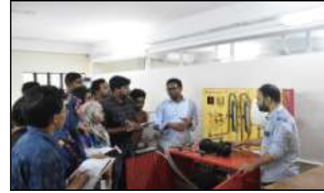
থার্মোডিনামিক্স ল্যাব (আইপিই)

'আইপিই' বিভাগের জন্য রয়েছে ফ্লুইড মেকানিক্স এন্ড মেশিনারি ল্যাব, থার্মোডিনামিক্স এন্ড হিট ট্রান্সফার ল্যাব, ম্যাটেরিয়ালস এন্ড মেকানিক্স ল্যাব, ম্যানুফেকচারিং প্রসেস ল্যাব, মেকানিক্যাল ওয়ার্কসপ, ড্রয়িং ল্যাব, নিজস্ব কম্পিউটার ল্যাব, সলিড মেকানিক্স ল্যাব, সিএনসি ল্যাব, ফাউন্ড্রি এন্ড কাস্টিং ল্যাব, এবং প্রোডাক্ট ডিজাইন এন্ড আর্গনোমিক্স ল্যাব।