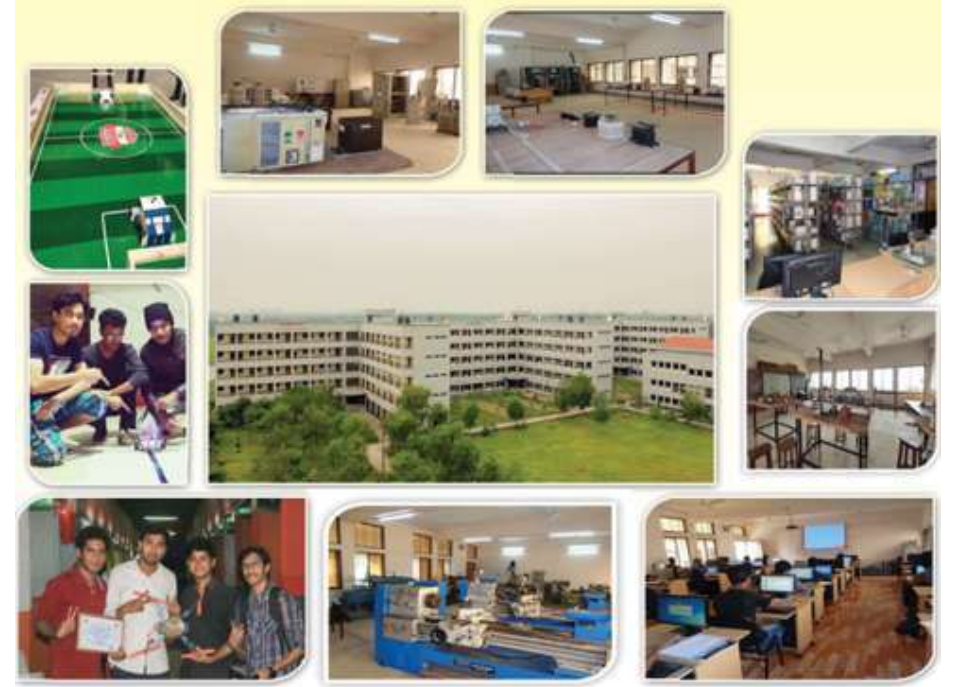
একাডেমিক ও প্রশাসনিক ভবনসমূহ

ফরিদপুর ইঞ্জিনিয়ারিং কলেজ গণপ্রজাতন্ত্রী বাংলাদেশ সরকারের শিক্ষা মন্ত্রণালয়ের কারিগরি ও মাদ্রাসা শিক্ষা বিভাগের অধিভুক্ত কারিগরি শিক্ষা অধিদপ্তরধীন একটি সরকারি শিক্ষা প্রতিষ্ঠান। কলেজটি ফরিদপুর শহর থেকে মাত্র ২.৭ কি.মি. দূরে অবস্থিত। কলেজটি ২০১০ সালে ৫ একর জায়গায় প্রতিষ্ঠিত হয়। ২০১৩ সাল থেকে এর একাডেমিক কার্যক্রম শুরু হয়। কলেজটির একাডেমিক কার্যক্রম ঢাকা বিশ্ববিদ্যালয়ের ইঞ্জিনিয়ারিং এন্ড টেকনোলজি অনুষদের অধীনে এবং প্রশাসনিক কার্যক্রম কারিগরি শিক্ষা অধিদপ্তরের অধীনে পরিচালিত হচ্ছে।