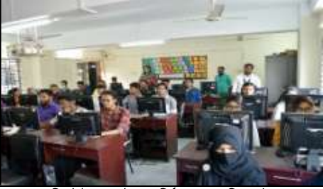
কম্পিউটার নেটওয়ার্কিং ল্যাব (সিএসই)

দেশের শিল্পখাতে কম্পিউটারাইজড পদ্ধতিতে সর্বাধুনিক প্রযুক্তি অনুযায়ী অটোমেশন করার লক্ষ্যে নিটারে ‘সিএসই’ বিভাগ চালু করা হয়েছে, যেখানে রয়েছে অত্যাধুনিক কম্পিউটার সমৃদ্ধ ২টি CAD-CAM ল্যাব, ১টি কমিউনিকেশন এন্ড কম্পিউটার নেটওয়ার্কিং ল্যাব, ১টি প্রোগ্রামিং ল্যাব ও ১টি অ্যাডভান্সড কম্পিউটিং ল্যাব।