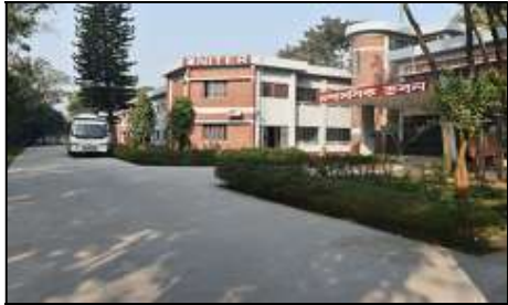
নিটার প্রশাসনিক ভবন