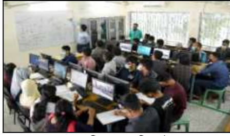
প্রোগ্রামিং ল্যাব (সিএসই)

দেশের বস্ত্র ও সহায়ক শিল্পখাতের কারখানা সমূহে প্রতিনিয়ত নিত্যনতুন বৈদ্যুতিক প্রযুক্তি উদ্ভাবিত হওয়ায় পর্যাপ্ত বৈদ্যুতিক প্রকৌশলী তৈরীর জন্য নিটারে ‘ইইই’ বিভাগ চালু করা হয়েছে। ‘ইইই’ বিভাগের গুরুত্বপূর্ণ ল্যাব সমূহের মধ্যে রয়েছে ইলেকট্রিক্যাল সার্কিটস/ইলেকট্রনিক্স/ভিএলএসআই ল্যাব, পাওয়ার সিস্টেম এন্ড কমিউনিকেশন ইঞ্জিনিয়ারিং ল্যাব, ইলেকট্রিক্যাল মেশিন এন্ড পাওয়ার ইলেকট্রনিক্স ল্যাব, কন্ট্রোল সিস্টেম এন্ড ইনস্ট্রুমেন্টেশন ল্যাব। সকল বিভাগ সমূহের কমন ল্যাবরেটরি হিসেবে রয়েছে রসায়ন ল্যাব, পদার্থবিজ্ঞান ল্যাব, মেকানিক্যাল ওয়ার্কশপ, ইঞ্জিনিয়ারিং ড্রয়িং/গ্রাফিক্স ল্যাব এবং অন্যান্য প্রয়োজনীয় ল্যাবরেটরি।