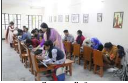
আর্ট ল্যাব (এফডিএই)

দেশের শিল্পখাতে কম্পিউটারাইজড পদ্ধতিতে সর্বাধুনিক প্রযুক্তি অনুযায়ী অটোমেশন করার লক্ষ্যে নিটারে ‘সিএসই’ বিভাগ চালু করা হয়েছে, যেখানে রয়েছে অত্যাধুনিক কম্পিউটার সমৃদ্ধ ২টি CAD-CAM ল্যাব, ১টি কমিউনিকেশন এন্ড কম্পিউটার নেটওয়ার্কিং ল্যাব, ১টি প্রোগ্রামিং ল্যাব ও ১টি অ্যাডভান্সড কম্পিউটিং ল্যাব।