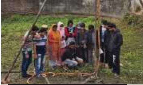
সয়েল টেস্টেং ল্যাবরটরী ক্লাশে শিক্ষার্থী

পৃথিবীতে উন্নত রাষ্ট্রগুলোক্রমেই উন্নত হচ্ছে এবং উন্নয়নশীল রাষ্ট্রগুলো উন্নতির দিকে ধাবিত হচ্ছে। রাষ্ট্র উন্নয়ন বলতে বুঝায় সে দেশের অর্থনৈতিক অবকাঠামো, যাতায়াত ব্যবস্থা উন্নয়ন এবং ইমারতগুলোর উন্নয়ন। ভূ-খন্ড নির্দিষ্ট কিন্তু জনসংখ্যা অপরিকল্পিতভাবে ক্রমাগত বৃদ্ধি পাচ্ছে এবং ভবিষ্যতেও বৃদ্ধি পেতে থাকবে। এই নির্দিষ্ট ভূ-খন্ডে জন-জীবনের জন্য মৌলিক চাহিদাগুলো যেমন: খাদ্য, বস্ত্র, বাসস্থান, শিক্ষা ইত্যাদির চাহিদা ক্রমশঃ বৃদ্ধি পাচ্ছে। একই সাথে বৃদ্ধি পাচ্ছে বেকারত্ব। তাই মৌলিক চাহিদা পূরণের সাথে সাথে বেকারত্ব দূরীকরণের ব্যবস্থাও গ্রহণ করতে হবে। সুনিয়ন্ত্রিত ও সুপরিকল্পিতভাবে নগর বাস্তুবায়ন, বহুতল ভবন, উন্নত সড়ক পথ, রেলপথ, ব্রীজ, কালভার্ট, বিমানবন্দর ইত্যাদি নির্মাণে Civil Engineering এর কোনো বিকল্প নাই।