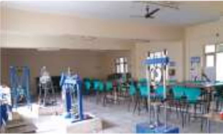
সিভিল ইঞ্জিনিয়ারিং ল্যাব