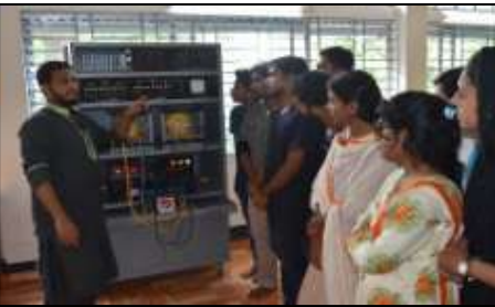
পাওয়ার ইলেকট্রনিক্স ল্যাব (ইইই)

ঢাকার অদূরে সাভারের নয়রহাট এলাকায় প্রায় ১৩ একর আয়তন বিশিষ্ট নিটারের নিজস্ব ক্যাম্পাস রয়েছে। ক্যাম্পাসে বিভিন্ন ভবনে প্রায় সোয়া-দুই লক্ষ বর্গফুট বিভিন্ন ভৌত অবকাঠামো রয়েছে। আবাসিক শিক্ষার্থীদের জন্য নিটার-এ রয়েছে পৃথক ছাত্র ও ছাত্রী হোস্টেল। ছাত্র হোস্টেলে ৪০০ জন এবং ছাত্রী হোস্টেলে ৩০০ জন শিক্ষার্থীর আবাসনের ব্যবস্থা রয়েছে। শিক্ষক-কর্মকর্তাদের জন্য ২টি আবাসিক কোয়ার্টার রয়েছে। নিটার এর ছাত্র-ছাত্রীদের জন্য রয়েছে ২টি প্রশস্ত খেলার মাঠ, সমগ্র ক্যাম্পাসে পরিকল্পিত রাস্তা, ক্যান্টিন ও ক্যাফেটেরিয়া, মেডিকেল সেন্টার, সংস্কৃতি বিকাশ কেন্দ্র সহ সবুজে ঘেরা নির্মল প্রাকৃতিক পরিবেশ সমৃদ্ধ অনন্য ক্যাম্পাস। ছাত্র-ছাত্রীদের ঢাকা হতে ক্যাম্পাসে যাতায়াতের সুবিধার্থে বাস সার্ভিস রয়েছে। উল্লেখ্য, ভর্তিকৃত ছাত্র-ছাত্রীদের মধ্য থেকে আর্থিকভাবে অস্বচ্ছল শতকরা ৫ (পাঁচ) জন মেধাবী শিক্ষার্থীকে সরকারি ইঞ্জিনিয়ারিং/টেক্সটাইল ইঞ্জিনিয়ারিং কলেজের অনুরূপ খরচে অধ্যয়নের সুযোগ রয়েছে।