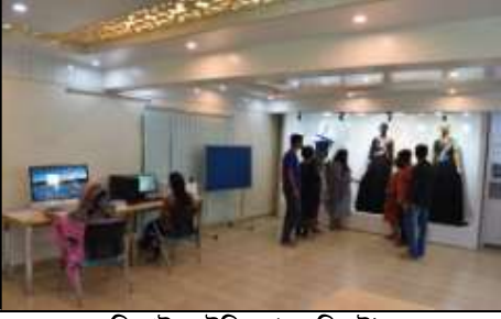
ডিজাইন স্টুডিও (এফডিএই)