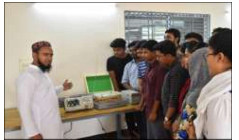
কমিউনিকেশন ইঞ্জিনিয়ারিং ল্যাব (ইইই)

দেশের বস্ত্র ও সহায়ক শিল্পখাতের কারখানা সমূহে প্রতিনিয়ত নিত্যনতুন বৈদ্যুতিক প্রযুক্তি উদ্ভাবিত হওয়ায় পর্যাপ্ত বৈদ্যুতিক প্রকৌশলী তৈরীর জন্য নিটারে ‘ইইই’ বিভাগ চালু করা হয়েছে। ‘ইইই’ বিভাগের গুরুত্বপূর্ণ ল্যাব সমূহের মধ্যে রয়েছে ইলেকট্রিক্যাল সার্কিটস/ইলেকট্রনিক্স/ভিএলএসআই ল্যাব, পাওয়ার সিস্টেম এন্ড কমিউনিকেশন ইঞ্জিনিয়ারিং ল্যাব, ইলেকট্রিক্যাল মেশিন এন্ড পাওয়ার ইলেকট্রনিক্স ল্যাব, কন্ট্রোল সিস্টেম এন্ড ইনস্ট্রুমেন্টেশন ল্যাব। সকল বিভাগ সমূহের কমন ল্যাবরেটরি হিসেবে রয়েছে রসায়ন ল্যাব, পদার্থবিজ্ঞান ল্যাব, মেকানিক্যাল ওয়ার্কশপ, ইঞ্জিনিয়ারিং ড্রয়িং/গ্রাফিক্স ল্যাব এবং অন্যান্য প্রয়োজনীয় ল্যাবরেটরি।