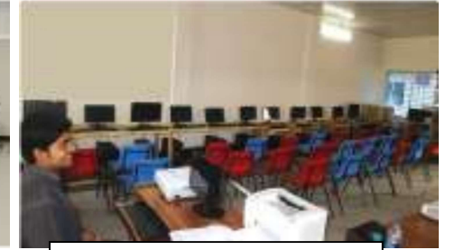
সফট ওয়্যার ল্যাব