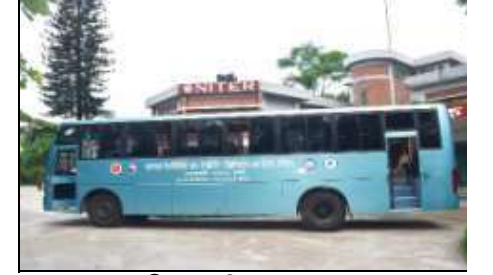
ছাত্র-ছাত্রীদের পরিবহনের জন্য বাস

২০২১ সাল পর্যন্ত নিটার হতে টেক্সটাইল ইঞ্জিনিয়ারিং প্রোগ্রামের ৭টি ব্যাচে মোট ৯৩০ জন এবং আইপিই প্রোগ্রামের ১টি ব্যাচের ৬২ জন ছাত্র-ছাত্রী সফলভাবে গ্রাজুয়েশন সম্পন্ন করেছে এবং তাদের ১০০% গ্রাজুয়েট দেশের বিভিন্ন খ্যাতনামা টেক্সটাইল শিল্পপ্রতিষ্ঠান, সরকারী বেসরকারী শিক্ষা প্রতিষ্ঠান ও ক্যাডার সার্ভিস সহ সরকারী গুরুত্বপূর্ণ প্রতিষ্ঠানে নিয়োজিত হয়েছে। এছাড়াও বিটিএমএ এর অধীনস্থ মিল সমূহে তারা অগ্রাধিকার ভিত্তিতে চাকুরীর সুযোগ পেয়ে থাকে। ছাত্র-ছাত্রীদের উচ্চশিক্ষার সুযোগ সৃষ্টি ও বিদ্যমান একাডেমিক সুবিধার যথাযথ ব্যবহারের লক্ষ্যে ২০১৮-২০১৯ শিক্ষাবর্ষ হতে নিটার-এ ঢাকা বিশ্ববিদ্যালয়ের ‘ইঞ্জিনিয়ারিং এন্ড টেকনোলজি অনুষদ’ এর অধীনে ৪০টি আসন নিয়ে মাস্টার্স ইন টেক্সটাইল ইঞ্জিনিয়ারিং প্রোগ্রাম এবং ২০১৯-২০২০ শিক্ষাবর্ষ হতে ‘বিজনেস স্টাডিজ অনুষদ’ এর অধীনে ৬০টি আসন নিয়ে এমবিএ ইন টেক্সটাইল এন্ড অ্যাপারেল ভ্যালু চেইন প্রোগ্রাম চালু করা হয়েছে, যার ফলে বস্ত্র ও সহায়ক শিল্প প্রকৌশলীগণ নিটারে উচ্চশিক্ষার সুযোগ লাভ করছে। ইতোমধ্যে মাস্টার্স ইন টেক্সটাইল ইঞ্জিনিয়ারিং প্রোগ্রামের ২টি ব্যাচ সফলভাবে মাস্টার্স প্রোগ্রাম সম্পন্ন করেছে।