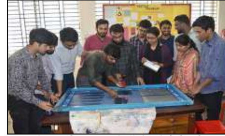
ওয়েট প্রসেসিং ল্যাব (টেক্সটাইল ইঞ্জিনিয়ারিং)

Industrial Relation (CRIR)', যার মাধ্যমে ইন্ডাস্ট্রি সম্পর্কিত বিভিন্ন ফলিত, বিশেষায়িত, ও মৌলিক গবেষণা কার্যক্রম পরিচালিত হচ্ছে। নিটার-এ ছাত্র-ছাত্রীদের অধ্যয়ন ও গবেষণার জন্য মাল্টিমিডিয়া সমৃদ্ধ আধুনিক ক্লাশরুম ও সর্বাধুনিক প্রযুক্তির যন্ত্রপাতি/ইকুইপমেন্ট সমৃদ্ধ ল্যাবরেটরি রয়েছে। এছাড়াও তথ্য-প্রযুক্তির সাথে সার্বক্ষণিক সংযুক্ত রাখার উদ্দেশ্যে সমগ্র ক্যাম্পাসকে ওয়াই-ফাই জোনে পরিণত করা হয়েছে। ক্যাম্পাসে দ্রুতগতির ও উচ্চ-ক্ষমতাসম্পন্ন ইন্টারনেট ব্যবস্থা বিদ্যমান থাকায় নিটারের ছাত্র-ছাত্রী, শিক্ষক, কর্মকর্তা এবং কর্মচারীগণ সকলেই অনলাইনের মাধ্যমে ভারুয়াল সভা এবং সেমিনার বা টেলি-কনফারেন্সিংয়ের সুবিধা প্রাপ্ত হচ্ছে। 'টেক্সটাইল ইঞ্জিনিয়ারিং' বিভাগের জন্য রয়েছে সর্বাধুনিক প্রযুক্তির যন্ত্রপাতি সমৃদ্ধ ইয়ার্ন ল্যাব, উইভিং ল্যাব, নিটিং ল্যাব, ফেব্রিক ল্যাব, অ্যাপারেল ল্যাব, ওয়েট প্রসেসিং ল্যাব, গার্মেন্টস ওয়াশিং ল্যাব, এবং টেক্সটাইল টেস্টিং এন্ড কোয়ালিটি কন্ট্রোল ল্যাব।