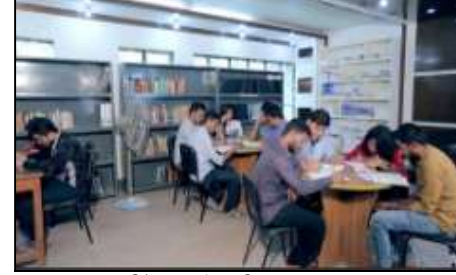
নিটার লাইব্রেরির একাংশ

ঢাকার অদূরে সাভারের নয়রহাট এলাকায় প্রায় ১৩ একর আয়তন বিশিষ্ট নিটারের নিজস্ব ক্যাম্পাস রয়েছে। ক্যাম্পাসে বিভিন্ন ভবনে প্রায় সোয়া-দুই লক্ষ বর্গফুট বিভিন্ন ভৌত অবকাঠামো রয়েছে। আবাসিক শিক্ষার্থীদের জন্য নিটার-এ রয়েছে পৃথক ছাত্র ও ছাত্রী হোস্টেল। ছাত্র হোস্টেলে ৪০০ জন এবং ছাত্রী হোস্টেলে ৩০০ জন শিক্ষার্থীর আবাসনের ব্যবস্থা রয়েছে। শিক্ষক-কর্মকর্তাদের জন্য ২টি আবাসিক কোয়ার্টার রয়েছে। নিটার এর ছাত্র-ছাত্রীদের জন্য রয়েছে ২টি প্রশস্ত খেলার মাঠ, সমগ্র ক্যাম্পাসে পরিকল্পিত রাস্তা, ক্যান্টিন ও ক্যাফেটেরিয়া, মেডিকেল সেন্টার, সংস্কৃতি বিকাশ কেন্দ্র সহ সবুজে ঘেরা নির্মল প্রাকৃতিক পরিবেশ সমৃদ্ধ অনন্য ক্যাম্পাস। ছাত্র-ছাত্রীদের ঢাকা হতে ক্যাম্পাসে যাতায়াতের সুবিধার্থে বাস সার্ভিস রয়েছে। উল্লেখ্য, ভর্তিকৃত ছাত্র-ছাত্রীদের মধ্য থেকে আর্থিকভাবে অস্বচ্ছল শতকরা ৫ (পাঁচ) জন মেধাবী শিক্ষার্থীকে সরকারি ইঞ্জিনিয়ারিং/টেক্সটাইল ইঞ্জিনিয়ারিং কলেজের অনুরূপ খরচে অধ্যয়নের সুযোগ রয়েছে।