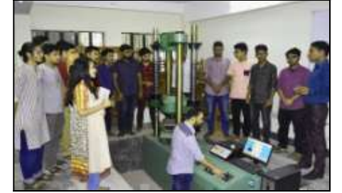
সলিড মেকানিক্স ল্যাব (আইপিই)

'এফডিএই' বিভাগের জন্য রয়েছে অত্যাধুনিক মেশিনারি ও সর্বাধুনিক প্রযুক্তি সমৃদ্ধ 'স্টেট অফ দ্য আর্ট' মানের ডিজাইন স্টুডিও এবং অন্যান্য ল্যাবের মধ্যে রয়েছে ড্রয়িং এন্ড কালার ল্যাব ও প্যাটার্ন ল্যাব। নিটারে পরিচালিত বিএসসি ইন এফডিএই প্রোগ্রামটি যেহেতু Textile ও Fashion Design বিষয়ের সমন্বিত একটি প্রোগ্রাম। তাই এই বিভাগের ছাত্র-ছাত্রীগণের Fashion Designing এর পাশাপাশি R&D, Fabric Styler, Merchandising সহ বিভিন্ন টেক্সটাইল ইন্ডাস্ট্রিতে চাকুরীর সুযোগ রয়েছে।